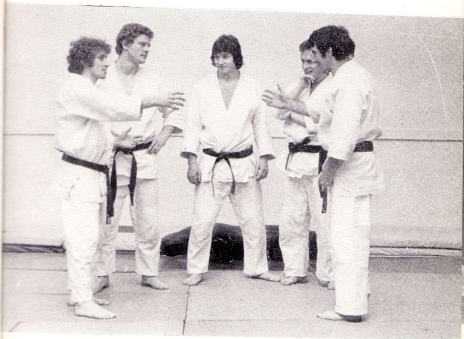
Drużynowy Mistrz Polski Seniorów w judo na 1975 rok