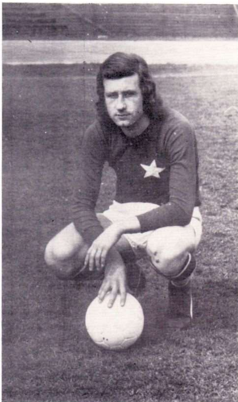
Antoni Szymanowski Najlepszy piłkarz Polski roku 1975. Zdobywca „Złotych butów” w sezonie 1974/75. Najlepszy sportowiec woj. krakowskiego w 1975 roku.