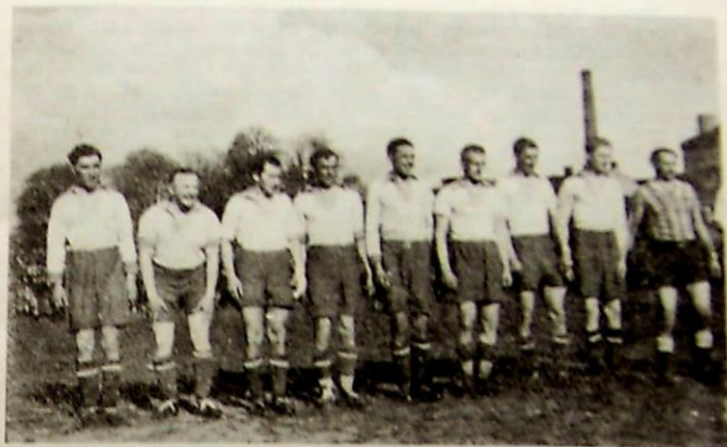
KS „Cracovia” 1943 r.