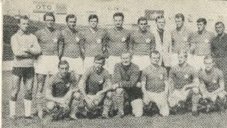
Drużyna „WISŁY” — zdobywca Pucharu Polski w 1967

Do trzech razy sztuka powiedzieli sobie piłkarze Wisły. I oto w roku 1967 pokonując Stal Mielec a później Legię, Ruch i GKS Katowice, przystępnili w Kielcach do finałowego meczu z Rakowem Częstochowa — drużyną ambitną i bojową. W normalnym czasie mecz zakończył się wynikiem bezbramkowym.