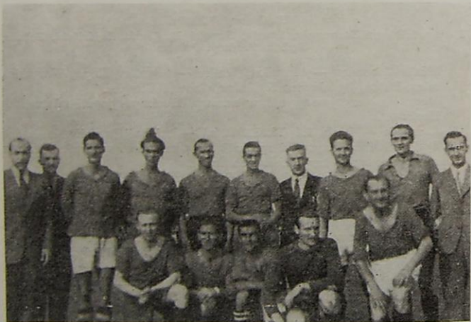
1943 rok Drużyna „Wisły” biorąca udział w jubileuszu 15-lecia Łagiewianki: