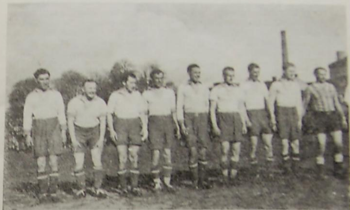
KS „Cracovia” 1943 r.