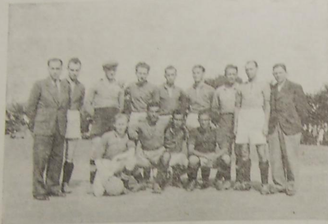
6.07.1941 r. „Wisła”: